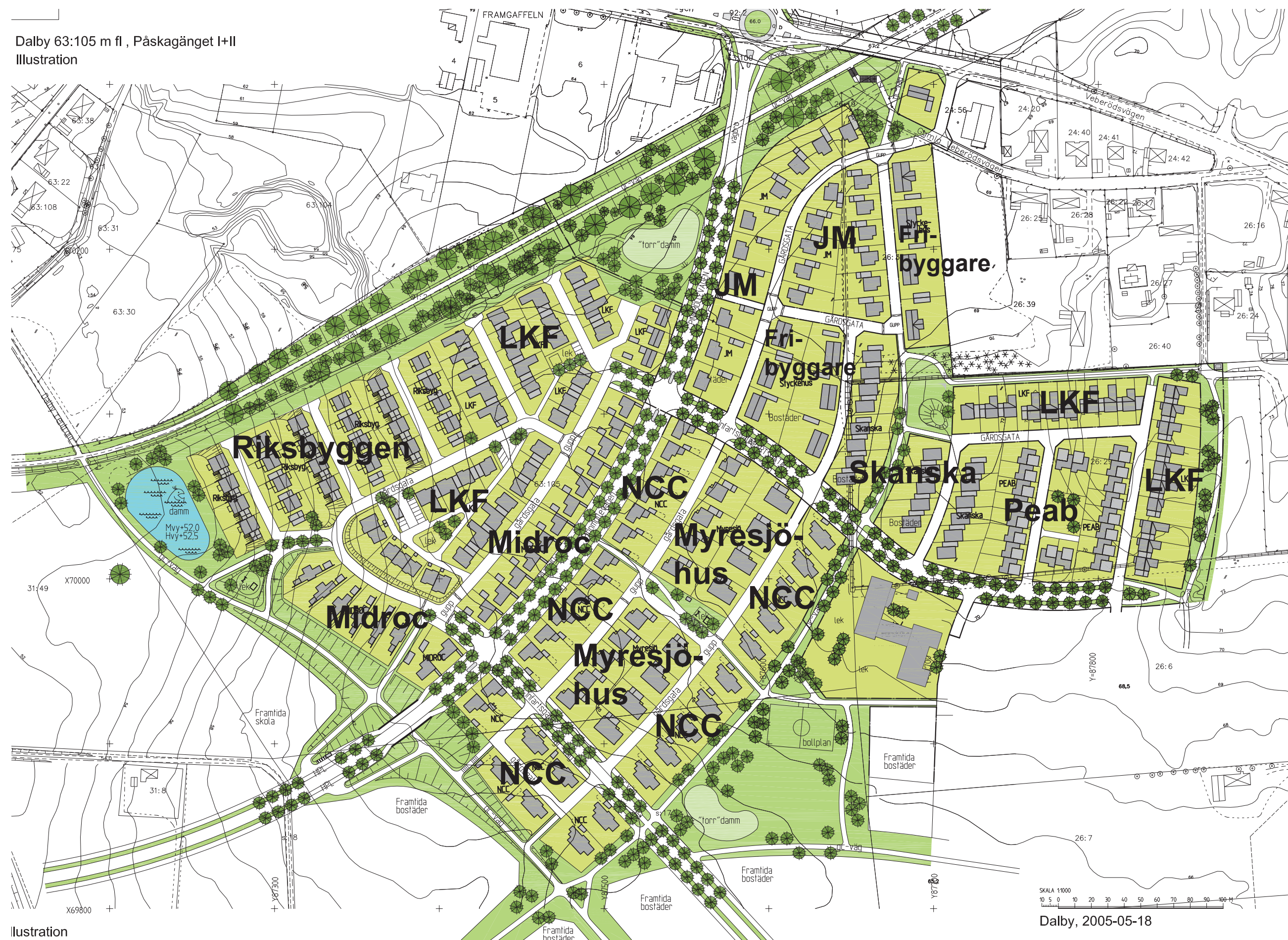
Dalby 63:105 m fl, Påskagänget I+II Illustration